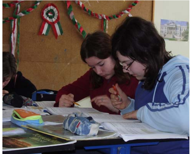
A biztonság kedvéért egymással is megbeszélik, mit olvastak, közösen értelmezik.