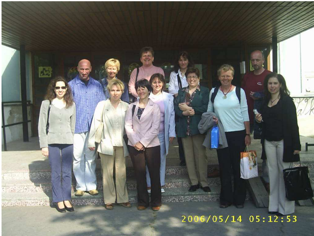
Résztevők a dunaszerdahelyi Szabó Gyula Alapiskola bejárata előtt